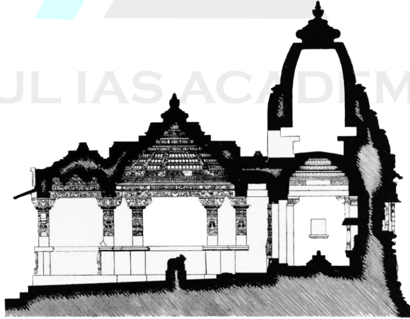
SECTION OF A VISHNU TEMPLE

கி.பி 1915 இல் வரையப்பட்ட நாகரா பாணியைச் சேர்ந்த சிவன் கோயிலின் வடிவமைப்பு.