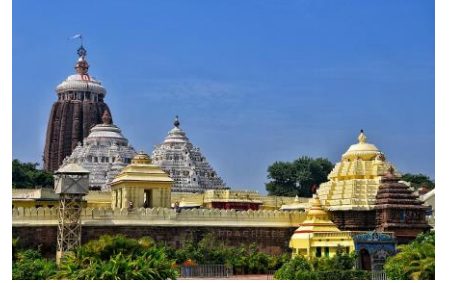
ஐகன்னாதர் கோவில், பூரி