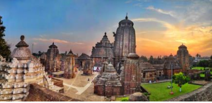
லிங்கராஜ் கோவில் வளாகம்

➤ ஓடிசா பள்ளி அல்லது துணை பாணி கிழக்கு இந்தியாவின் கடலோரப் பகுதிகளில், குறிப்பாக தற்போதைய இந்திய மாநிலமான ஓடிசா மற்றும் ஆந்திரப் பிரதேசம் ஓடிசாவின் எல்லையில் உருவானது. இந்த பள்ளி அல்லது கோயில் கட்டுமானத்தின் துணை பாணி கலிங்க பள்ளி அல்லது துணை பாணி என்றும் அழைக்கப்படுகிறது.