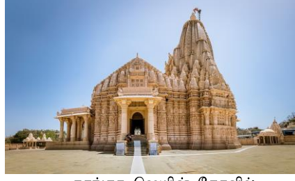
தரங்கா ஜெயின் கோவில்