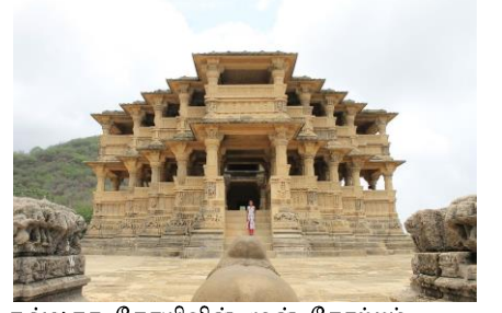
நவலகா கோயிலின் முன் தோற்றம்